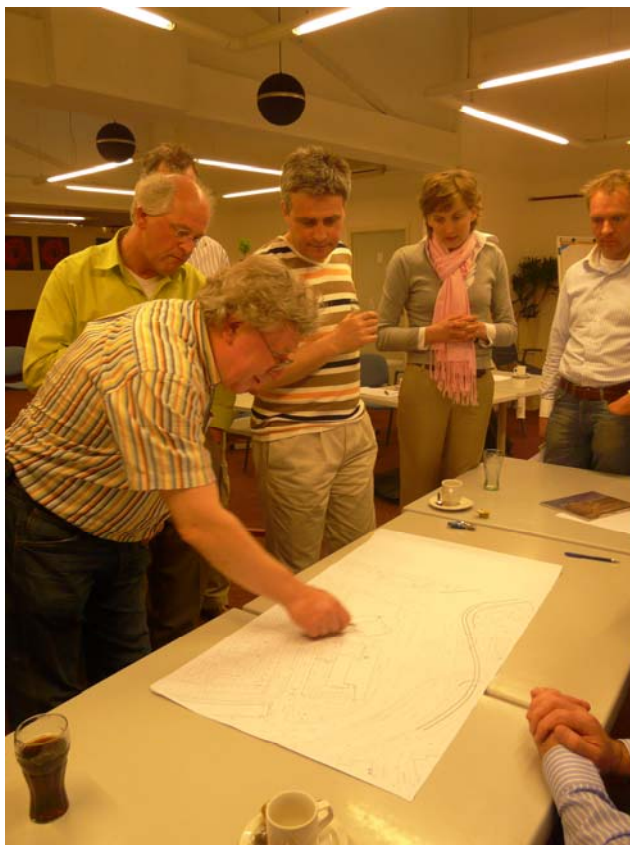
Leden van de klankbordgroep geven hun ideeën voor de inrichting van het plein.

sociale veiligheid, ruimte voor activiteiten/evenementen. De ontwerper van de gemeente gaat aan de slag met de schetsen die ter plekke werden gemaakt en met de verdere suggesties van de klankbordgroep. Daarbij houdt zij ook rekening met eerdere adviezen van de klankbordgroep. Als het ontwerp, samen met de klankbordgroep, verder is uitgewerkt, wordt een moment gekozen om dit aan de wijk te presenteren.