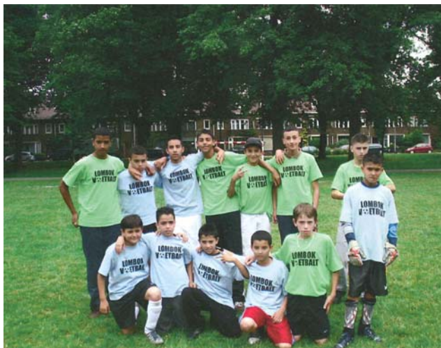
Lombok Voetbalt 2008

Zondag 28 juni 2009 is het weer zover: het Majellapark staat dan in het teken van Lombok voetbalt. Dit jaar alweer voor de twaalfde keer. Iedereen vanaf 8 jaar uit de wijk Lombok kan meedoen. Voor meer informatie of om in te schrijven kijkt u op de site van Portes: www.portes.nl/lombokvoetbalt .