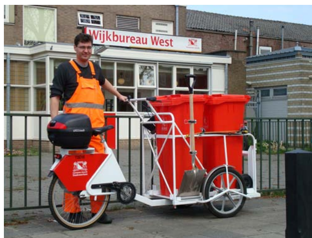
Buurtveger van Lombok